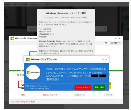
(犯人が実際に表示した警告画面)